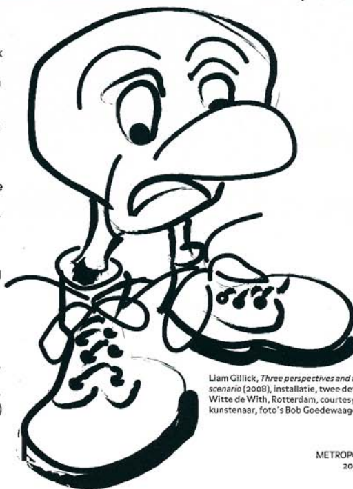
Liam Gillick, Three perspectives and a short scenario (2008), installatie, twee details, Witte de With, Rotterdam, courtesy de kunstenaar

De vloeren van Witte de With zijn bekleed met een zacht, muisgrijs tapijt. Het keukenblok voor het personeel en de opslagruimte ertegenover hebben een strakke, grijze ombouw gekregen. De tentoonstellingszalen zijn van elkaar gescheiden door houten schermen of wanden van ongeveer twee meter hoog. Hun transparantie ontlenen ze aan de, eveneens, grijze horizontale latjes waarvan ze zijn gemaakt. De bijkans anonieme inrichting van Witte de With staat in sterk contrast met de kleurrijke, architectonische installaties en structuren, veelal van plexiglas en aluminium, die we van Liam Gillick (1964) kennen. 'Three perspectives and a short scenario is een andersoortige expositie', legt Gillick uit. 'Deze tentoonstelling gaat, gek genoeg, over mij'. Het project omvat naast deze presentatie (één van de drie perspectives )